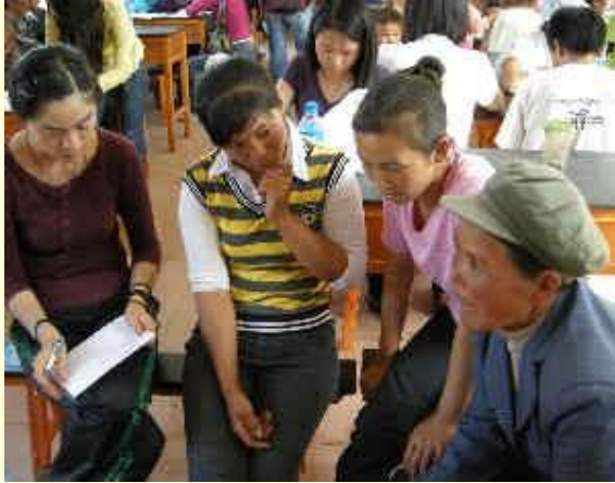
中国一些学生在考虑有关环境议题的输入资料

公民参与不单单是一件好事或该做的事；事实上它会形成更好的结果与治理。当以一种有意义的方式完成时，公民参与会造成两项重大效益：